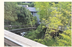
▲露天風呂へ行く ロープウェイ