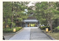
▲ホテル正面入り口

近場には有名なラーメン屋があったり、バスも運行し、どこへでも行きやすいことから立地も良いと思いました。